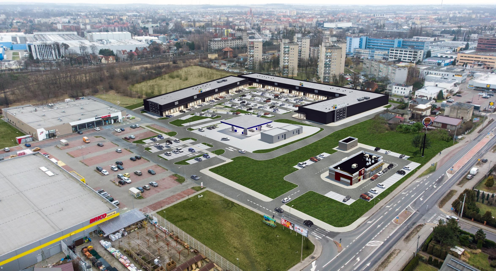
Ostrów Wielkopolski ul. Poznańska